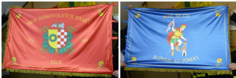
Slavnostní prapor SDH Kruh

Prapor byl představen starostou sboru Romanem Kuzelem členům SDH na Výroční valné hromadě dne 9.1.2010 a veřejnosti na 100. hasičském bále dne 6.2.2010