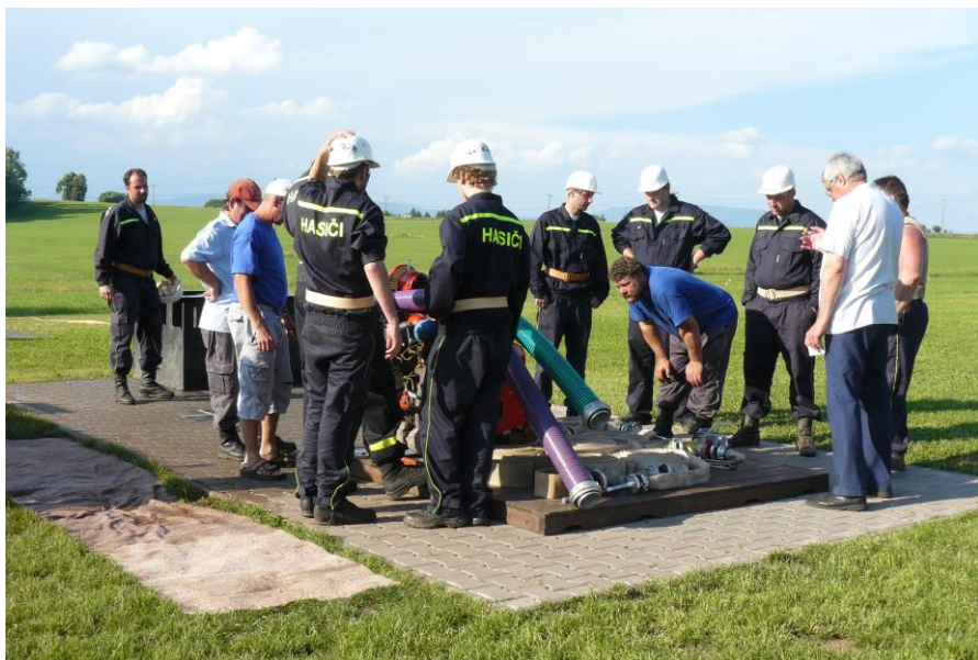
Okrsková soutěž v Nedaříži 16.6.2012

Hlavní činnost sboru během roku se soustřeďuje na kulturní a společenský život v obci. V únoru pořádáme tradiční Hasičský bál (letos v pořadí již 103.), v červnu Pouťové posezení u hasičské zbrojnice, v srpnu tradiční Posezení pod lipou, finančně přispíváme na pořádání dětského karnevalového odpoledne, každý rok pomáháme s organizací dětského dne, spolupořádáme Adventní podvečer.