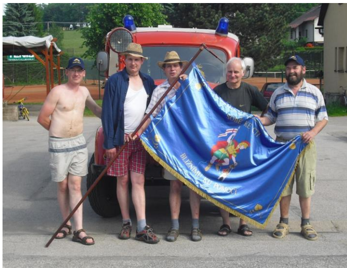
Odjezd do Litoměřic na Hasičské slavnosti 10.6.2010

Sbor se účastní okrskových soutěží v požárním sportu, s vozidlem Mercedes se účastní oslav výročí založení okolních sborů, výstavy hasičské techniky v Litoměřicích, ...