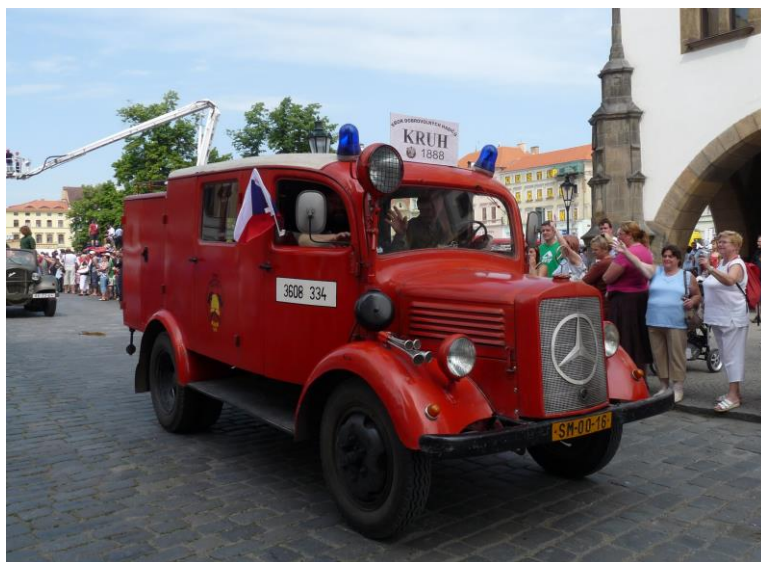
Hasičské slavnosti Litoměřice 12.6.2010