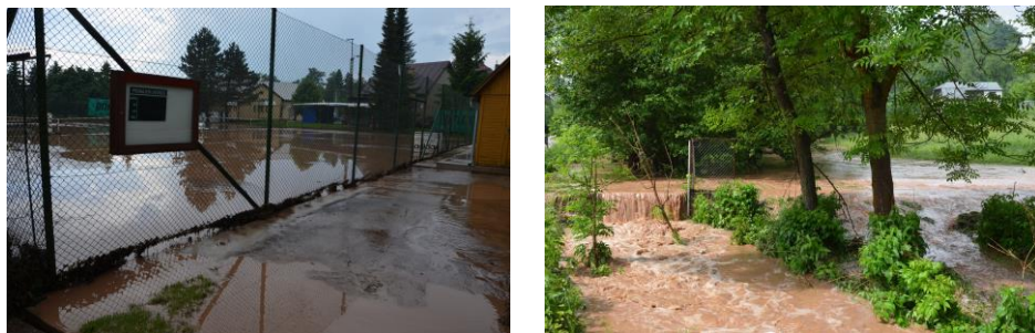
Zatopené tenisové kurty, rozvodněný potok 8.6.2013