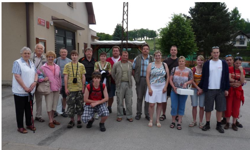
Výlet do Litoměřic na Hasičské slavnosti 12.6.2010