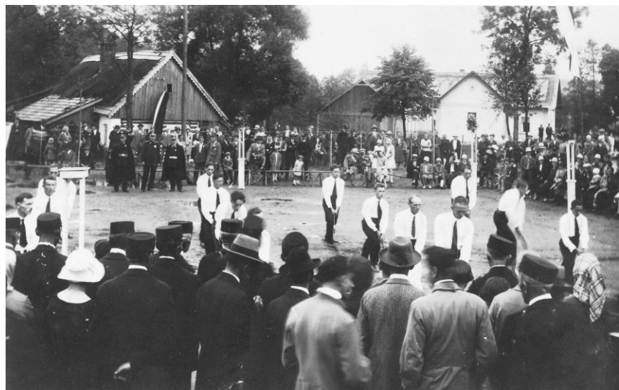
Hasičská slavnost r.1930, vlevo Vanclovi (nyní park), vpravo zbrojnice