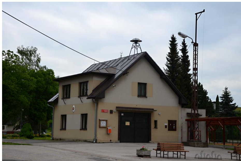
Hasičská zbrojnice v roce 2013