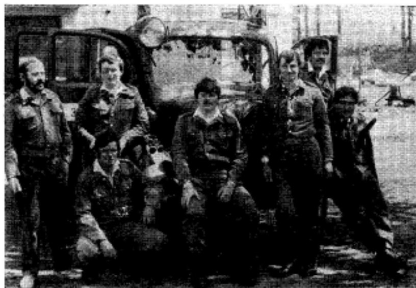
Soutěžní družstvo mužů v roce 1987

Oba tyto dokumenty se stanou dalším vodítkem v práci a životě požární ochrany a bude na nás, abychom se podle nich řídili v naší práci.